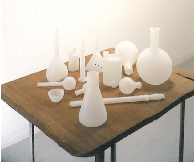
Tony Cragg トニー・クラッグ 《Untitled》 1987年 glass, wood, iron 103 x 81.5 x 125 cm かんらん舎「Tony Cragg」展示風景より (会期 1987年12月1日-12月26日) © KANRANSHA