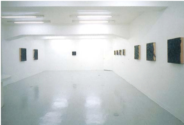
Imi Knoebel イミ・クネーベル 《Black Painting》 1991年 oil on fiberboard かんらん舎「Imi Knoebel -BLACK PAINTINGS-」展示風景より (会期 1992年1月20日-2月15日)